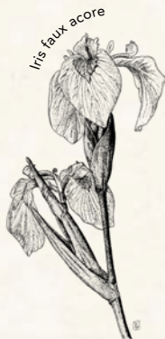
Iris faux acore